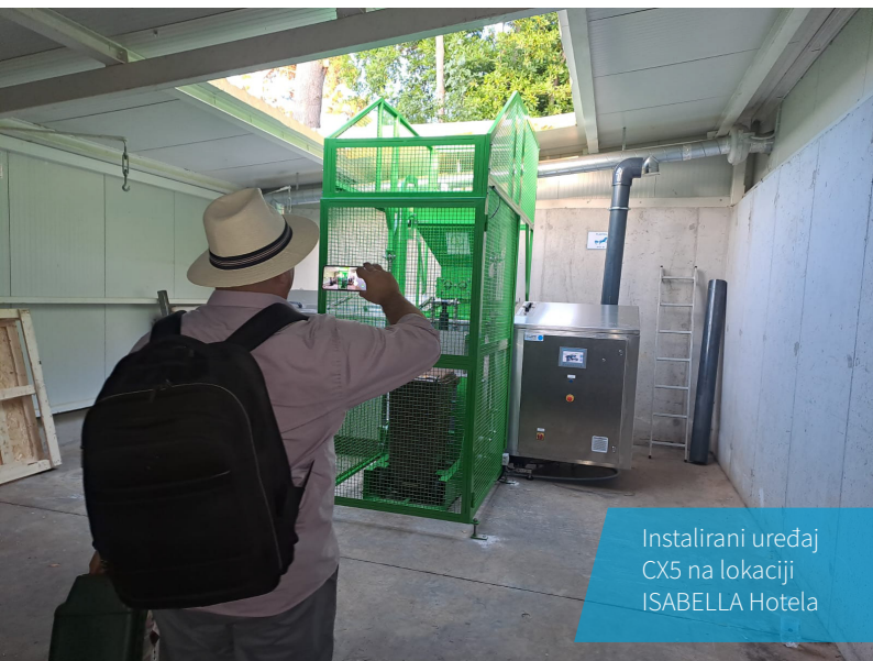
Instalirani uređaj CX5 na lokaciji ISABELLA Hotela

(Kwh/godišnje) 39674; 3 Phase / 400V / 16A